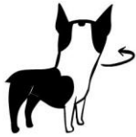
“VREDE!” wegkijken/ hoofd weggedraaien