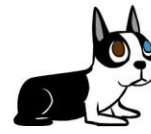
“JIJ ZULT ME ETEN GEVEN”