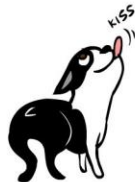
VRIENDELIJK & BELEEFD gebogen lichaam