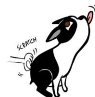
“IK HOU VAN JE. NIET OPHOUDEN”