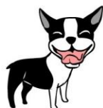
VROLIJK of heet