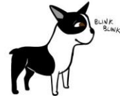
ONTSPANNEN neutrale oren knipogen