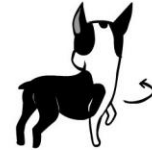
“RESPECT!” wegdraaien & lopen