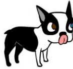
GESTRESSD neus likken