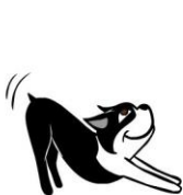
“HALLO IK HOU VAN JE” begroetingsrek